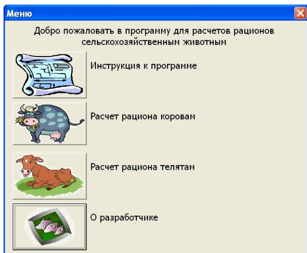
Рисунок 1 – Меню программы

Научные сотрудники и преподаватели могут применять программу с разными целями: