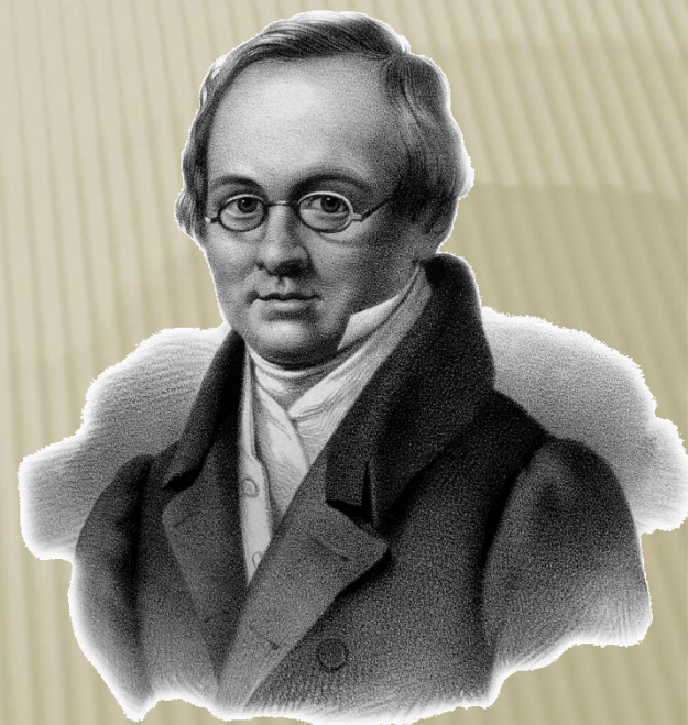
Дельви́г Антон Антонович