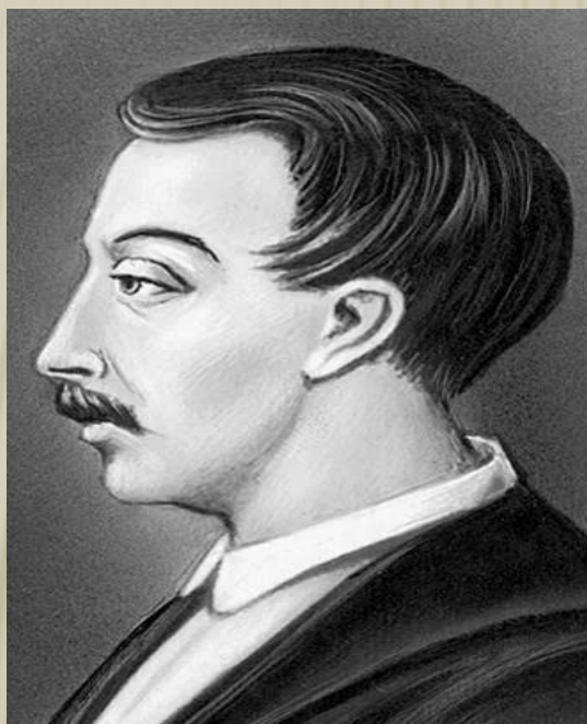
Кюхельбекер Вильгельм Карлович