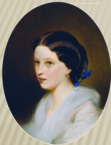
Старшая дочь Мария Александровна Пушкина (1832- 1919г.)

У Александра Сергеевича Пушкина и его жены Натальи Николаевны Гончаровой было четверо детей.