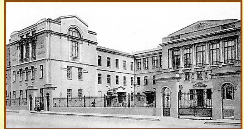
Академия Коммунистического Воспитания им. Н.К.Крупской

В Красной Армии окончил Красноармейский Университет и получил звание художника средней квалификации.