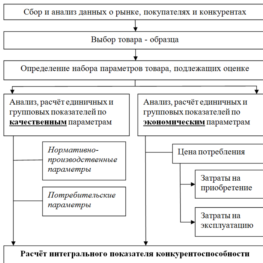
Рис 1. Примерная схема оценки уровня конкурентоспособности товара Последовательность расчёта интегрального показателя конкурентоспособности товара представлена в таблице 2.