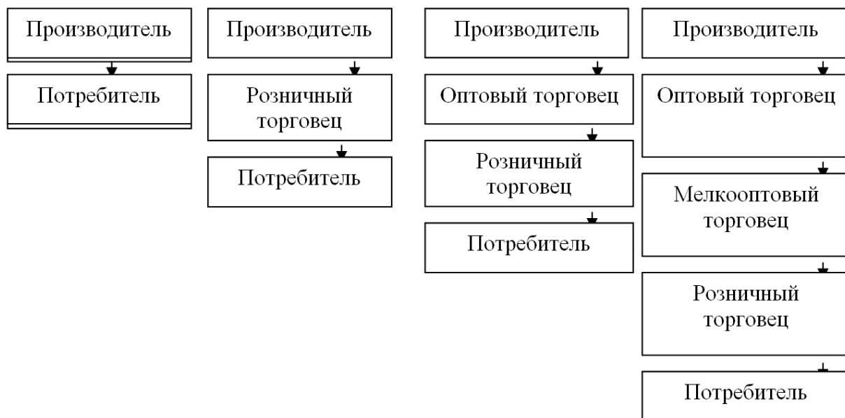
Рис. 2. Схема возможных каналов распределения товаров

Маркетинговая стратегия включает выбор распространения товара, определение цены реализации, разработку рекламы.